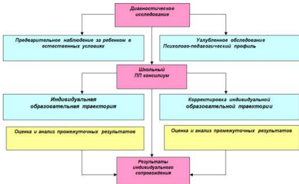
Рисунок 2. Схема взаимодействия педагогов и специалистов